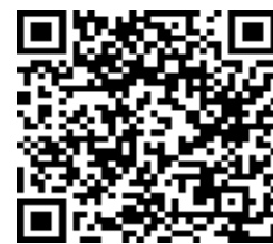
HEBO houten deuren